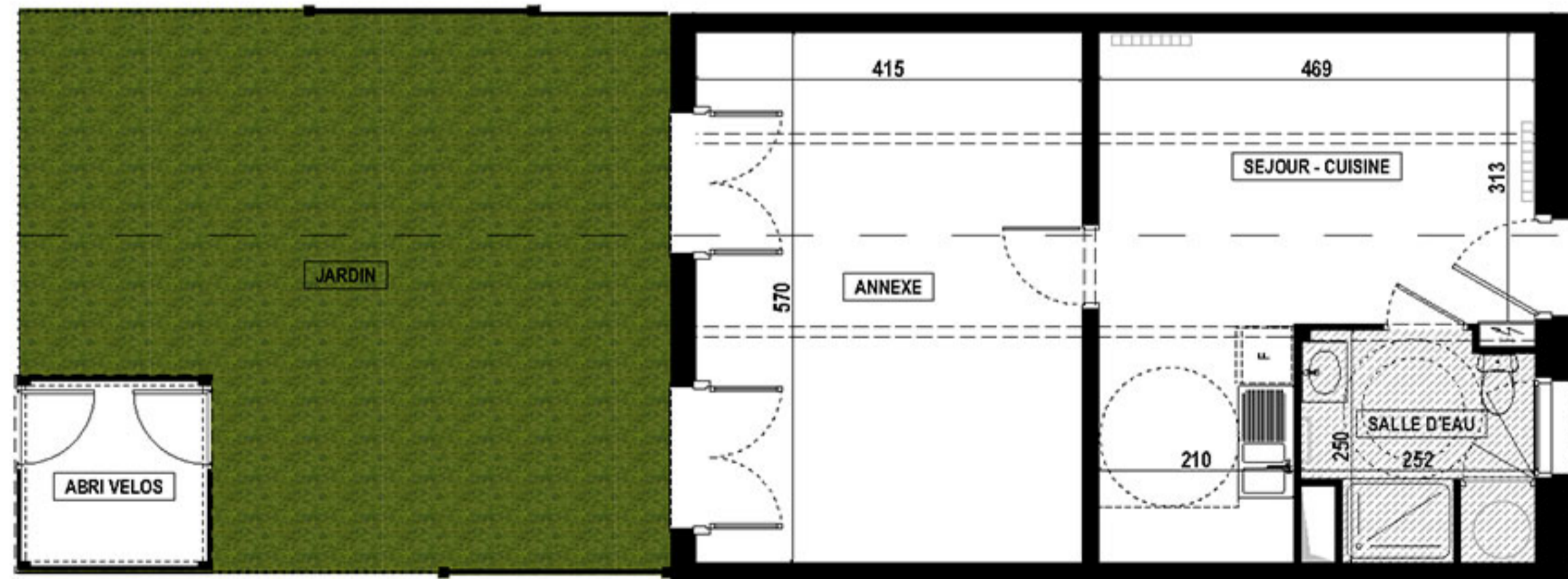
REZ DE CHAUSSEE