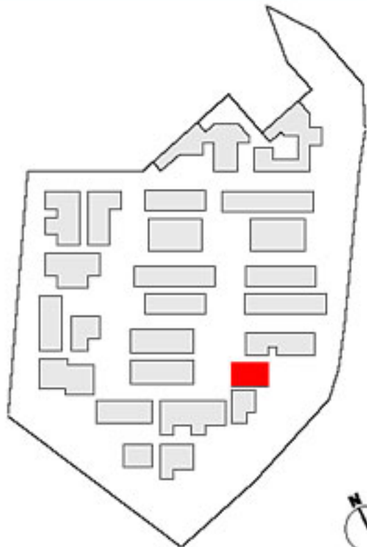
Repérage niveau 1